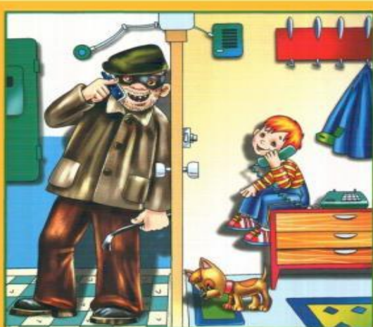
Не разговаривай и не открывай дверь незнакомым людям