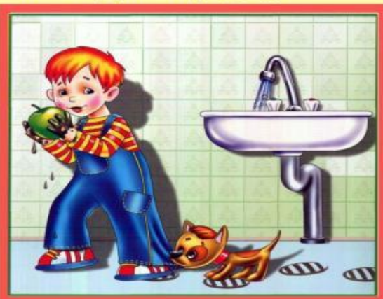
Мойте руки перед едой