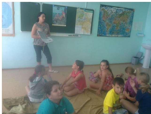
Кружок «Умелые ручки»

котором ты живёшь – тема дня. Викторина на эту тему показала, что дети знают деревья и лекарственные травы, растущие в нашем краю. А также реки нашей области и соседние с Самарской областью.