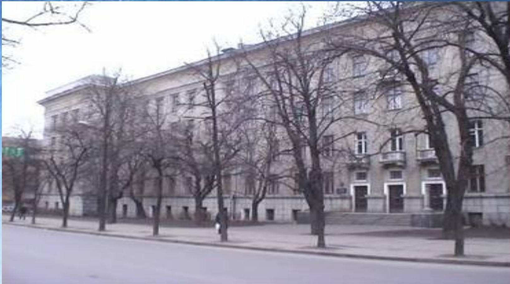
Чугуевское авиационное училище